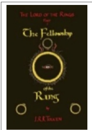
La Jaquette Mystérieuse

Tolkien avait dessiné à l'origine trois projets de jaquettes pour les trois tomes de LR .